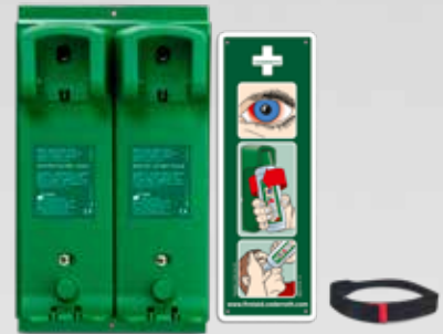
CEDERROTH SEINÄTELINE REF 7202

Vihreästä nylonista valmistettu vyökotelo taskukokoiselle Cederroth silmänhuuhtelupullolle (REF 7221). Mitat: L 8 x K 16 x S 4,5 cm