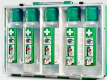
CEDERROTH SILMÄNHUUHTELUPAKKI REF 7255

2 x 500 ml, steriili, puskuroitu, säilöntäaineeton keittosuolaliuos. Kertakäyttöinen. Pullon mitat: Ø 6,5 x 23,5 cm Säilyvyysaika 4,5 vuotta.