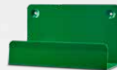
CEDERROTH SEINÄTELINE REF 190400

Tukee pulloa olosuhteissa, joissa sen on mahdollista liikkua, kuten kuorma-autot, trukit jne.