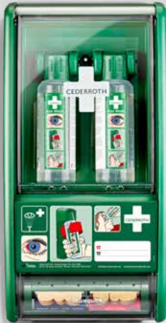
CEDERROTH SILMÄNHUUHTELUASEMA REF 721500

Sisältö: 2 x 500 ml Cederroth silmänhuuhtelu (REF 725200) Salvequick laastariautomaatti, sis. 40 Salvequick kangaslaastari (REF 6444) 45 Salvequick muovilaastari (REF 6036) I Silmänhuuhteluohje I Laastariautomaatin avain