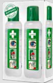
CEDERROTH SILMÄNHUUHTELUPULLO REF 725200

Itsekiinnittyvä muovinen seinäpidike opastekilvälle.