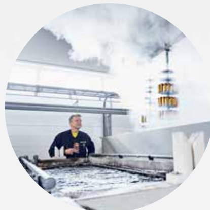
TYÖPAJAT JA TEOLLISUUSYMPÄRISTÖT