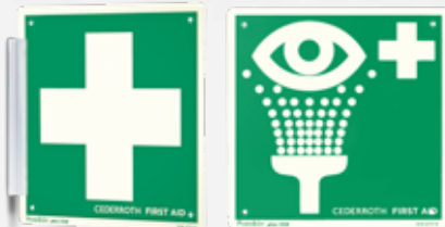
OPASTEKILPI, RISTI REF 1738

Kaksipuolinen, jälkivalaiseva. 20 x 20 cm.